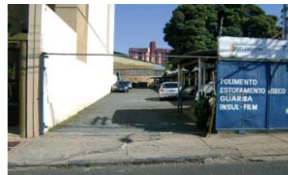
O TERRENO da sede Regional Paranaíba, fica na rua Tenente Virmondes, 790

O terreno adquirido pela AFFEMG tem área de 580 m 2 , no centro da cidade, e já está em condições de receber edificações. O projeto arquitetônico está sendo concluído para ser encaminhado para aprovação da Prefeitura. Tão logo seja aprovado, a Diretoria dará início às obras. A sede seguirá o padrão das demais regionais, com instalações para o setor administrativo, uma sala multiuso para a organização de reuniões, palestras e outros eventos, e uma área para as confraternizações dos associados.