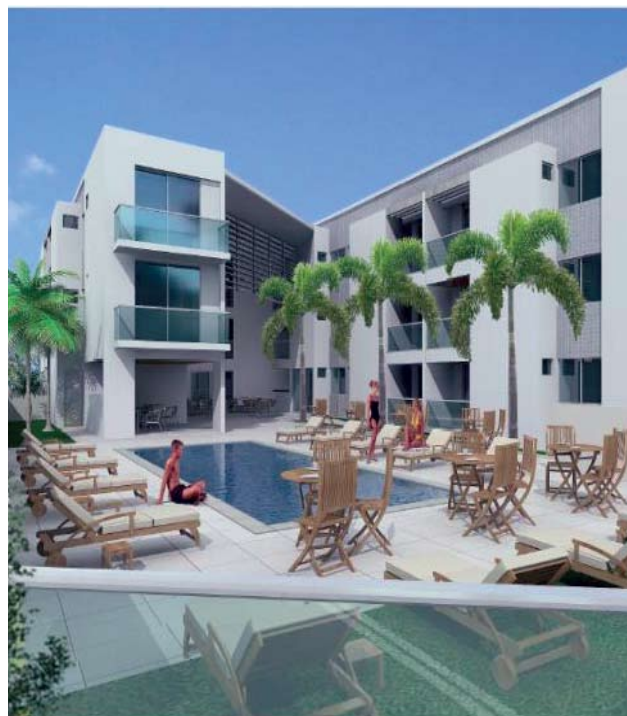
COLÔNIA do Guarujá - projeto da Fachada

Na área de lazer o projeto inclui 2 piscinas (adulto e infantil), sauna, área de jogos com sinuca e mesas de carteadado, churrasqueira e sala de TV. Cada apartamento poderá ocupar uma vaga de garagem.