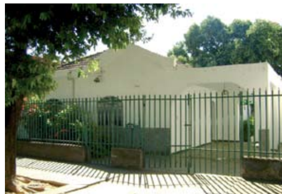
SEDE da Regional Doce, rua Francisco Sales, 364

Fica no bairro Esplanada, em Governador Valadares, a futura sede da Diretoria Regional Rio Doce. A AFFEMG comprou uma casa que tem terreno de 400m 2 . Será reformada e adaptada ao padrão das Regionais, com instalações que atendem plenamente às necessidades dos associados. Composta de 3 ambientes: uma área administrativa para atendimento da AFFEMG e FUNDAFFEMG; um salão multiuso para reuniões e eventos de confraternização e, nos fundos, área de lazer com churrasqueira para encontros de associados.