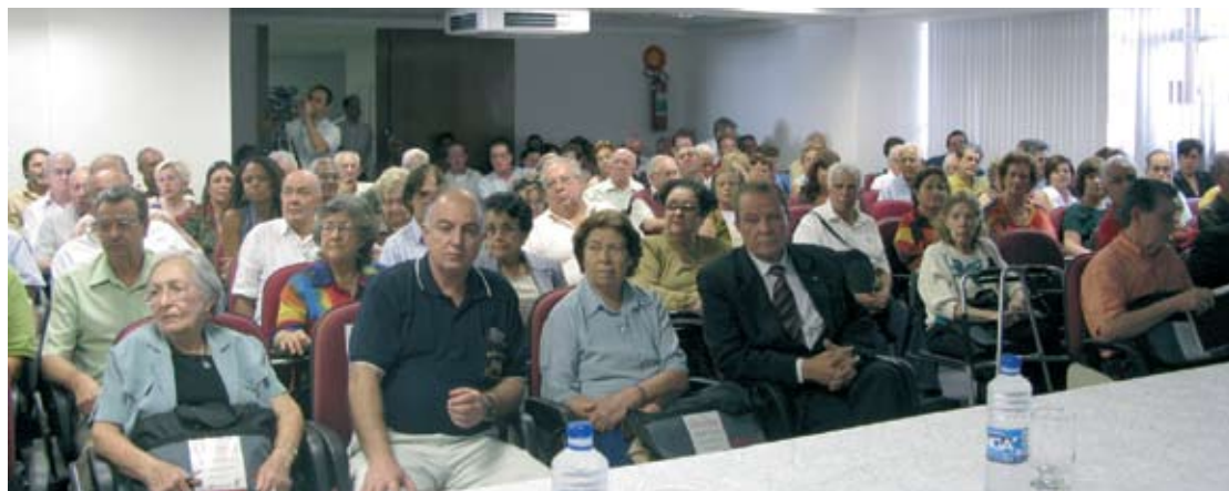
APOSENTADOS e pensionistas discutiram problemas e formas de lutas conjuntas