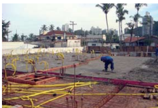
16 DE JULHO: concretagem da primeira laje do térreo