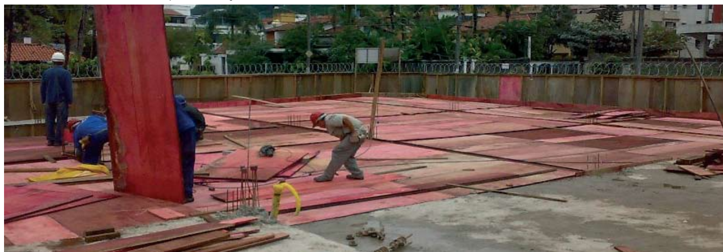
20 DE JULHO: montagem da forma para o restante da laje do térreo.