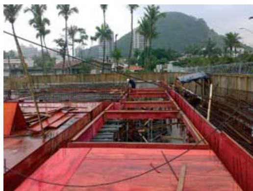
10 DE JULHO: forma e escoramento da primeira laje do térreo

Continua a todo vapor construção da Colônia de Férias da AFFEMG em Guarujá, no litoral de São Paulo. Acompanhe o ritmo dos trabalhos pela sequência de fotografias tiradas na obra durante o mês de julho. A colônia fica na Praia da Enseada, a menos de um quarteirão da orla.