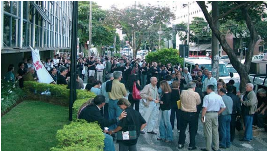
MANIFESTAÇÃO DO dia 19, na porta da SEF, contra o decreto de promoção por escolaridade