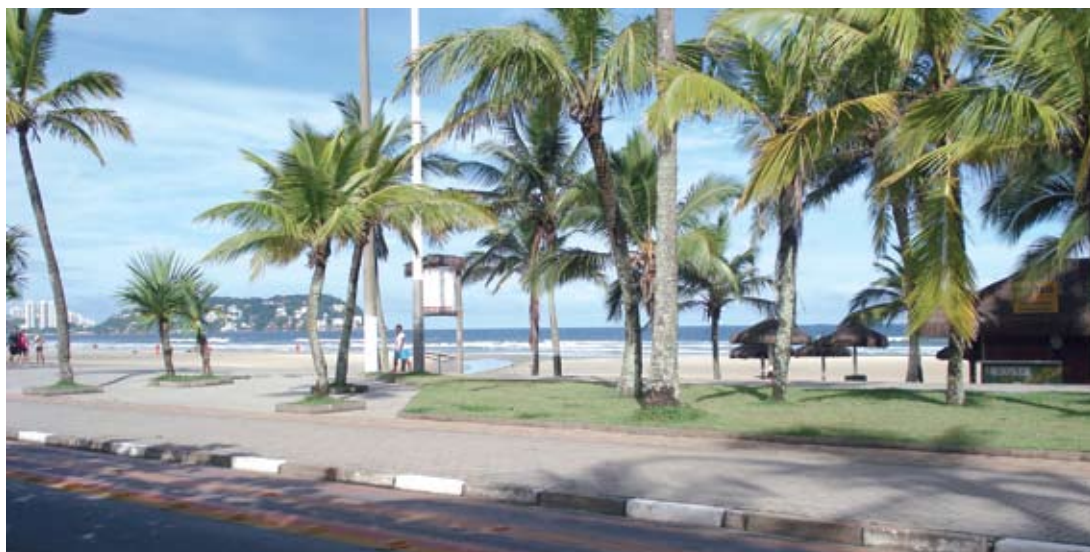
CALÇADÃO DA praia da Enseada, no Guarujá, próximo ao terreno adquirido pela AFFEMG

Informativo da Associação dos Funcionários Fiscais do Estado de Minas Gerais ■ Ano XVIII ■ nº 222 ■ junho de 2008