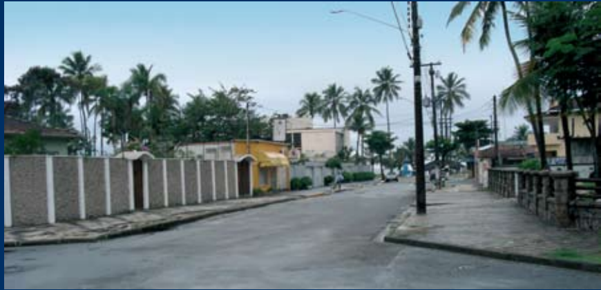
O MURO da esquerda será a futura colônia de férias do Guarujá. Nos coqueiros ao fundo fica a praia da Enseada

Para os interessados em conhecer essa rica região brasileira, a Acta Turismo oferece pacotes com 5% de desconto para os associados da Affemg. Informações: 3244.5000.