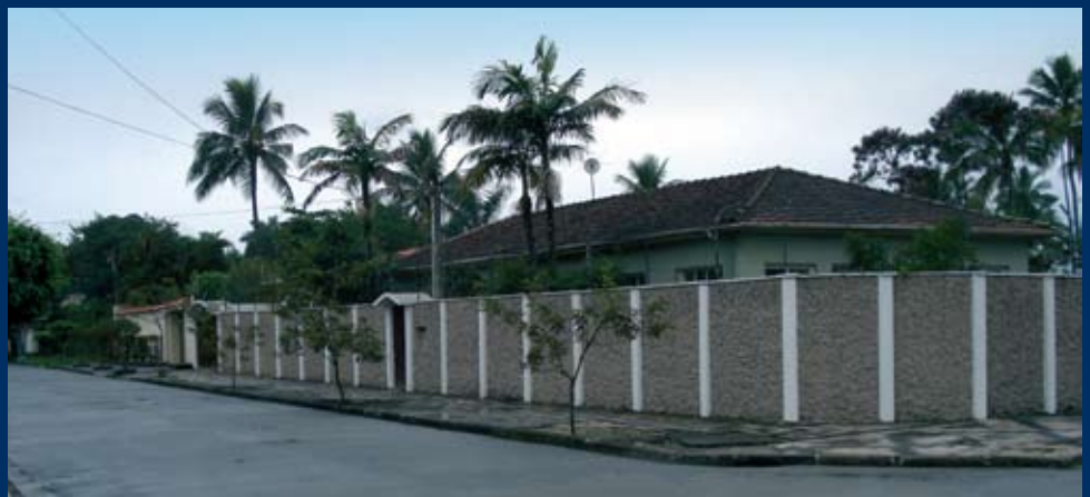
O TERRENO fica na Av. Santa Maria, 84 esquina c/ Rua Santa Rosa

A Colônia de Férias da AFFEMG em Guarujá será erguida bem pertinho da Praia da Enseada, considerada a melhor daquele balneário paulista. O terreno foi adquirido no início de junho e já é parte do patrimônio dos associados. São 1.200 metros quadrados que ficam a menos de uma quadra da beira-mar, bem pertinho do calçadão da praia. O projeto arquitetônico está sendo elaborado e deverá ser concluído no mês de Julho. Tão logo seja aprovado na prefeitura do Guarujá terão início as obras.